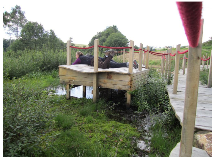
Beobachtungsposten Arnikaschleife