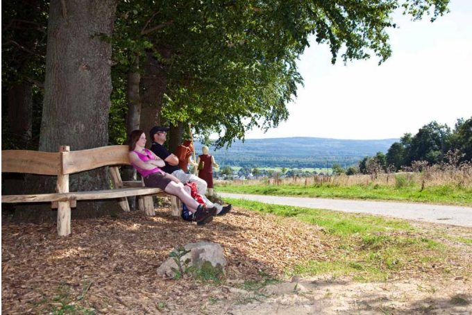
Standort Figurengruppe "Römer" Autor: Karl-Heinz Erz