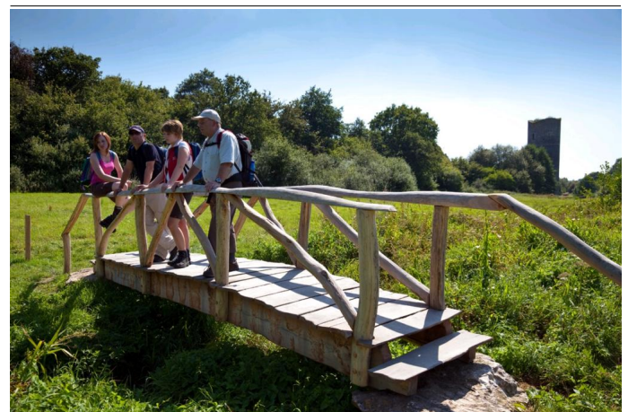
Wandergruppe Holzsteg in Arnikaschleife