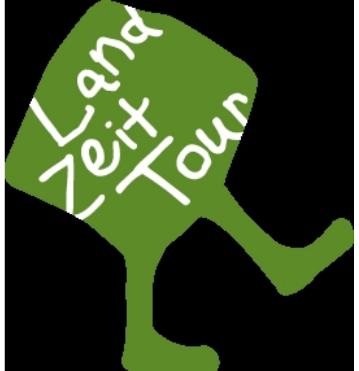
Logo "Baldu" der LandZeitTour