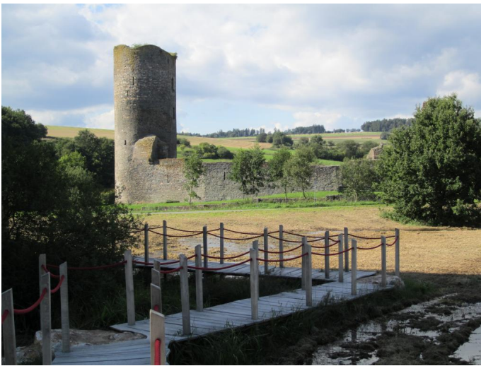
wasserburgruine Baldenau